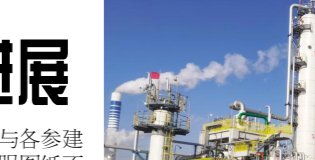
图为天津分公司“两化”搬迁改造工程 80 万吨年 VCM 项目

丙烯、乙稀压缩机组油循环工作是压缩机单机试车的提前提,PDH 项目三部团结协作,迎难而上,稳扎稳打把核心设备关键环节做在前面,为下一步厂家技术服务创造条件,力争提前实现哈萨克项目 IPCI 项目 PDH 装置机械竣工、项目投产的总体目标。