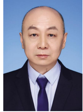
图为公司结对帮扶的华池县城壕镇向品