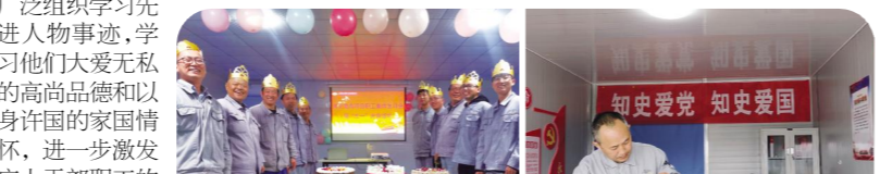
项目部为职工过集体生日 党员为项目职工义务理发